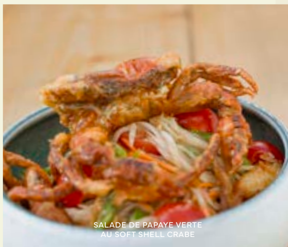
SALADE DE PAPAYE VERTE AU SOFT SHELL CRABE