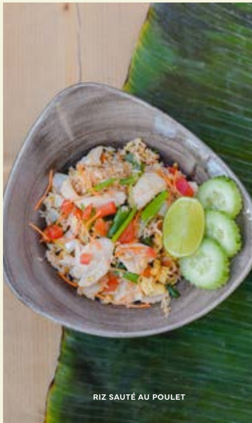
RIZ SAUTÉ AU POULET