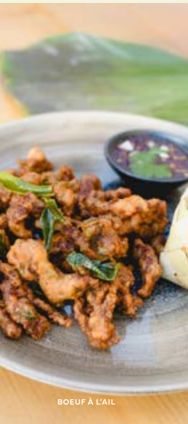
BOEUF À L'AIL