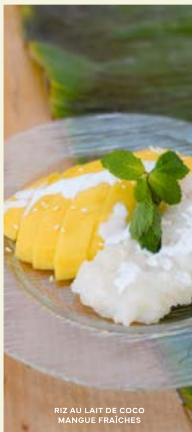
RIZ AU LAIT DE COCO MANGUE FRAÎCHES