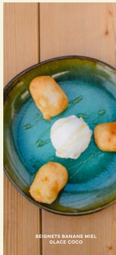
BEIGNETS BANANE MIEL GLACE COCO