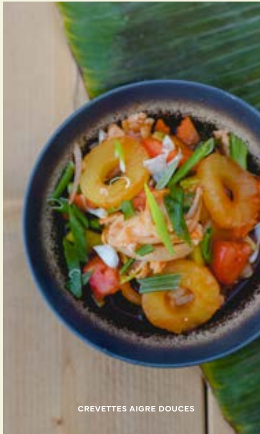
CREVETTES AIGRE DOUCES