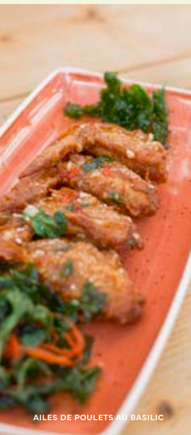
AILES DE POULETS AU BASILIC