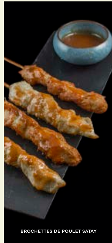
BROCHETTES DE POULET SATAY