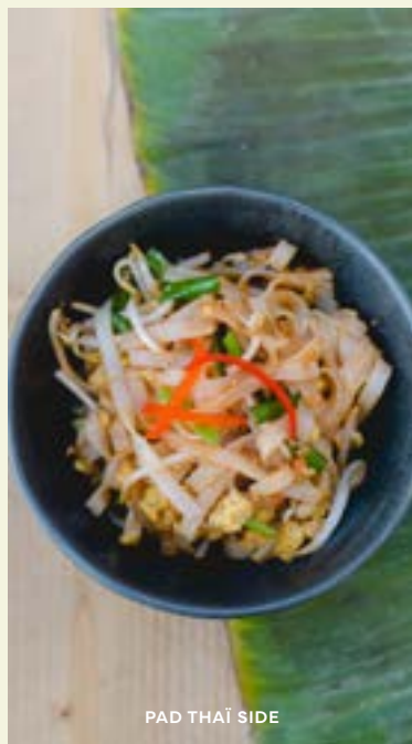
PAD THAI SIDE