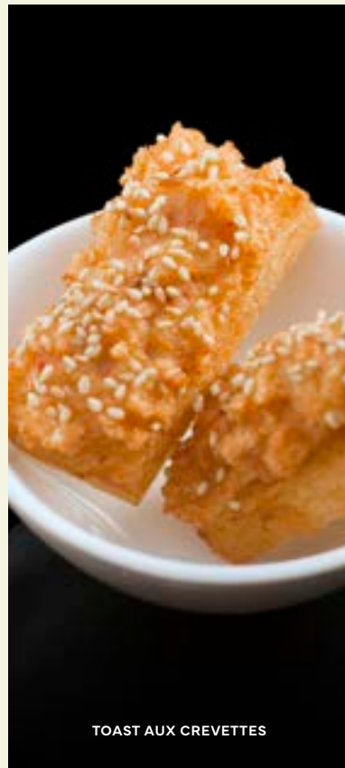
TOAST AUX CREVETTES