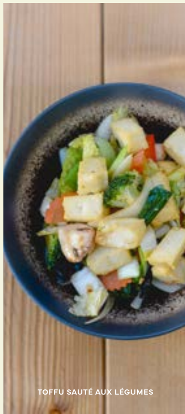
TOFFU SAUTÉ AUX LÉGUMES