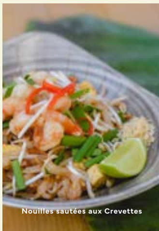
Nouilles sautées aux Crevettes