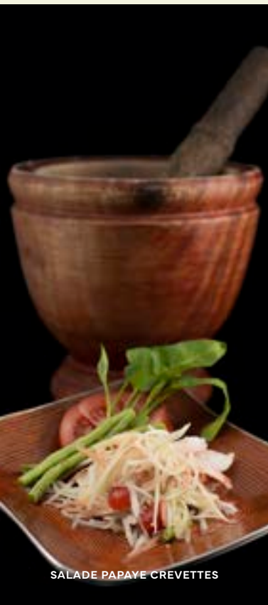
SALADE PAPAYE CREVETTES