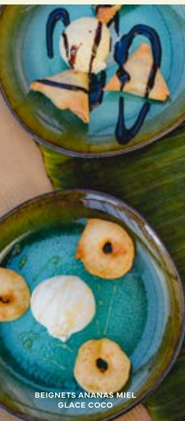
BEIGNETS ANANAS MIEL GLACE COCO