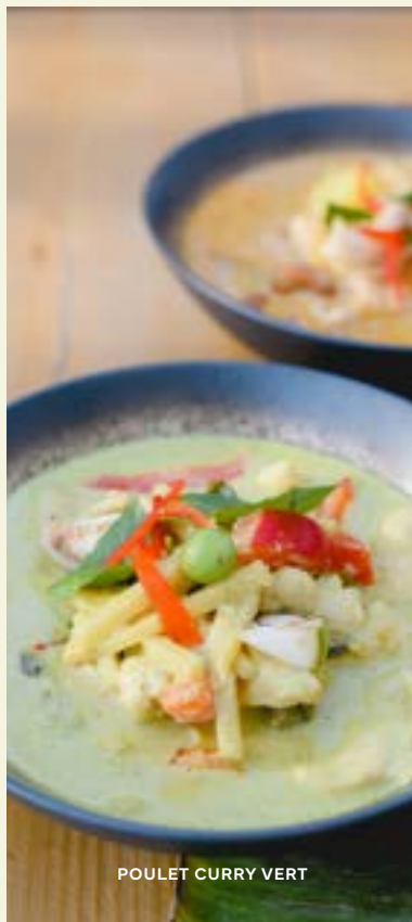
POULET CURRY VERT