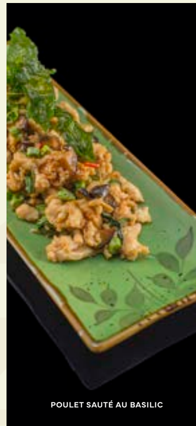
POULET SAUTÉ AU BASILIC