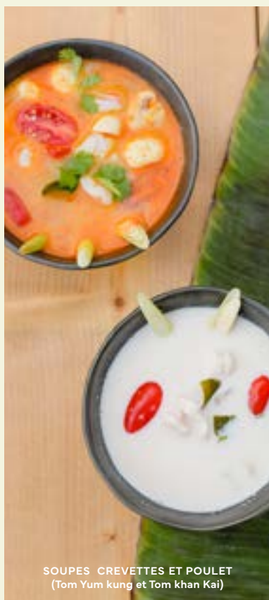
SOUPES CREVETTES ET POULET (Tom Yum kung et Tom Khan Kai)