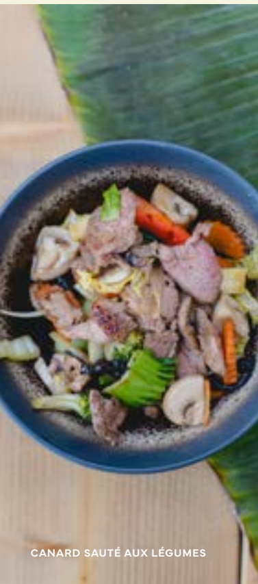
CANARD SAUTÉ AUX LÉGUMES