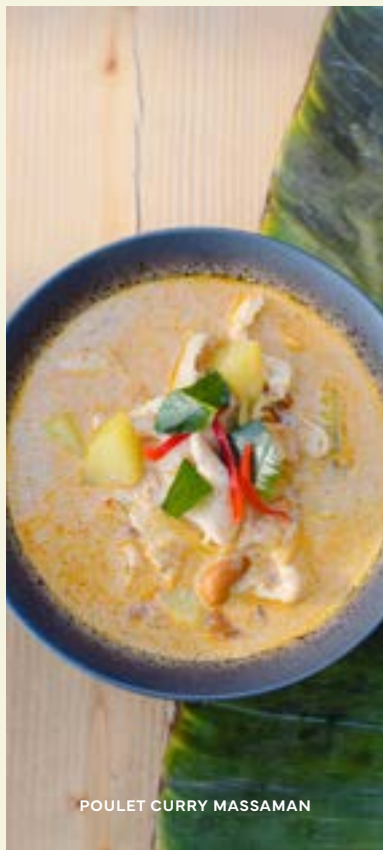
POULET CURRY MASSAMAN