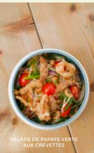
SALADE DE PAPAYE VERTE AUX CREVETTES