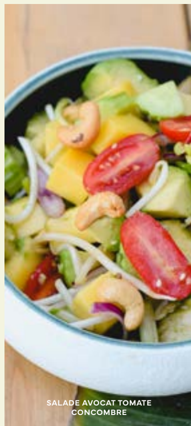
SALADE AVOCAT TOMATE CONCOMBRE