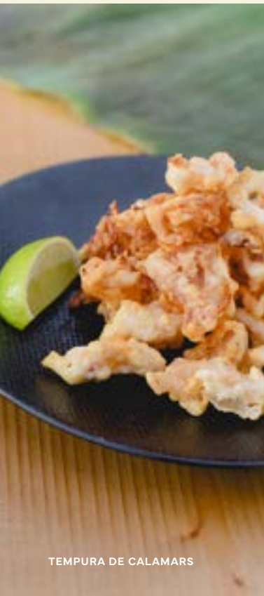
TEMPURA DE CALAMARS