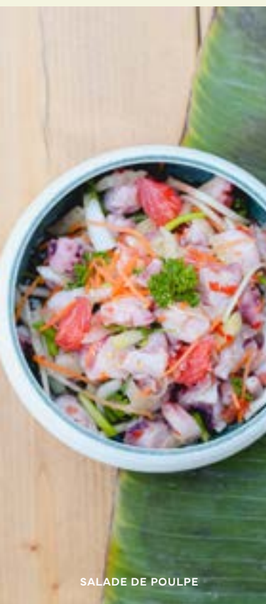
SALADE DE POULPE