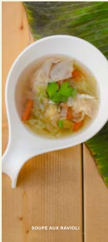
SOUPE AUX RAVIOLI