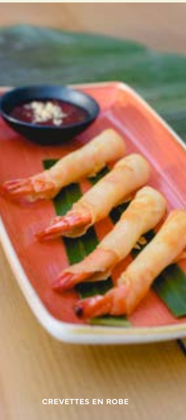
CREVETTES EN ROBE