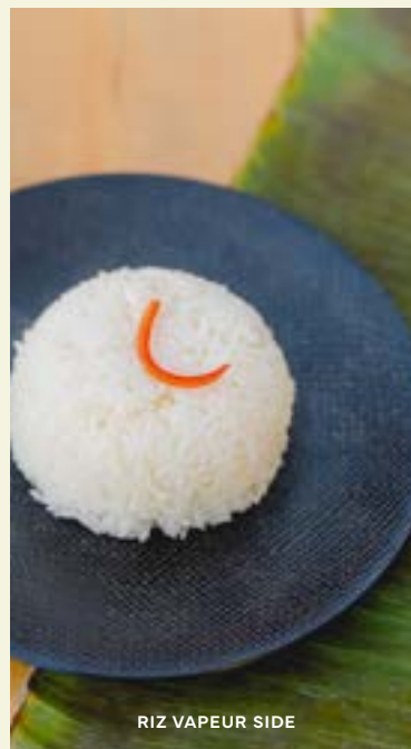
RIZ VAPEUR SIDE