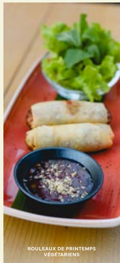
ROULEAUX DE PRINTEMPS VÉGÉTARIENS