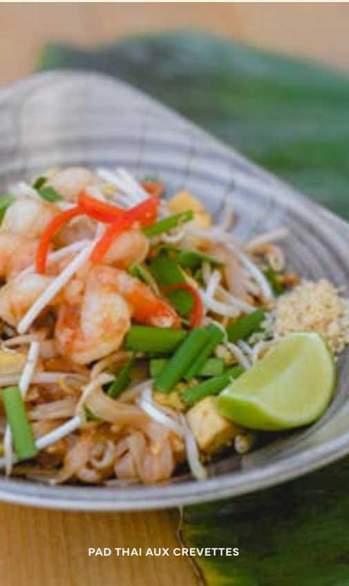
PAD THAI AUX CREVETTES