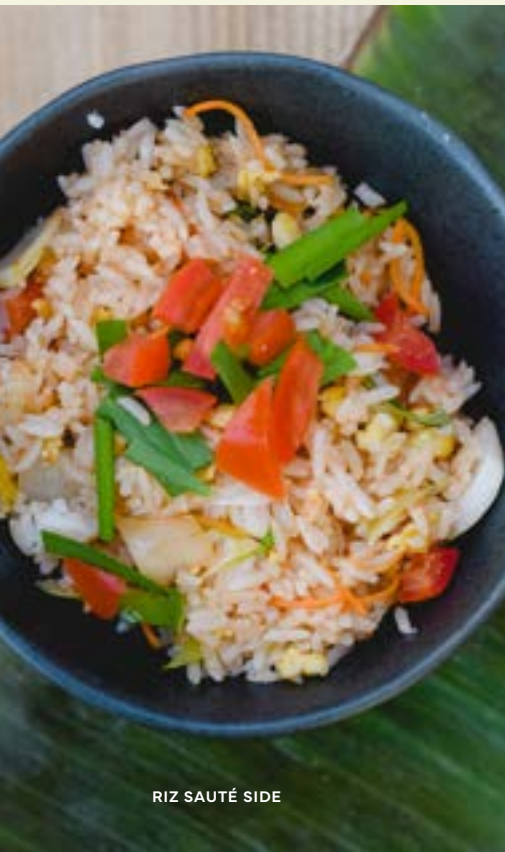
RIZ SAUTÉ SIDE