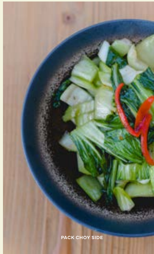
PACK CHOY SIDE