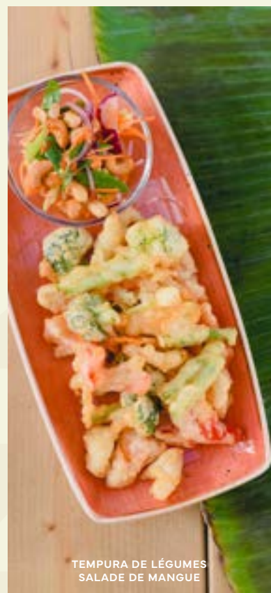
TEMPURA DE LÉGUMES SALADE DE MANGUE