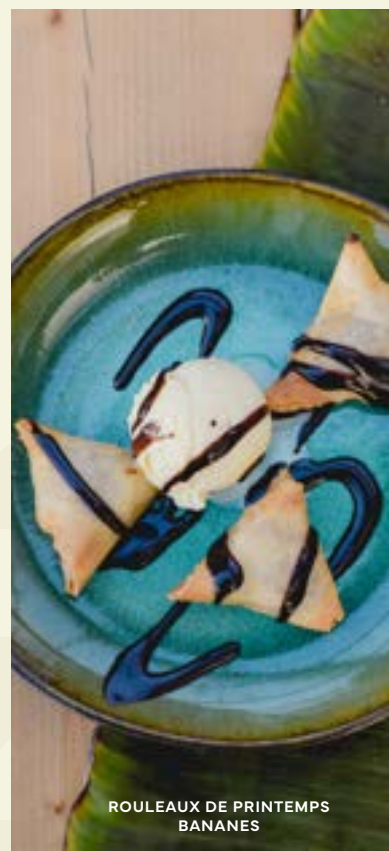
ROULEAUX DE PRINTEMPS BANANES