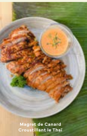
Magret de Canard Croustillant le Thaï

FILET DE POISSON AUX LEGUMES ( Frit ) Vegetable Fish