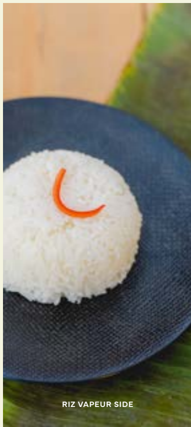
RIZ VAPEUR SIDE