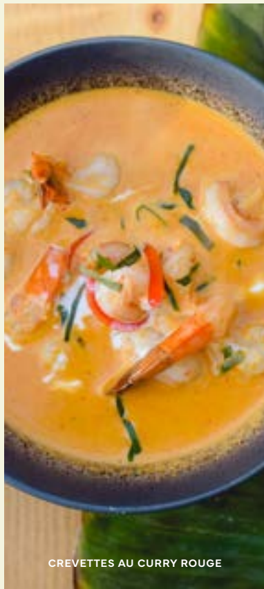
CREVETTES AU CURRY ROUGE