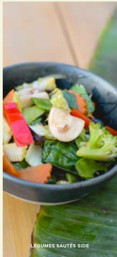
LÉGUMES SAUTÉS SIDE