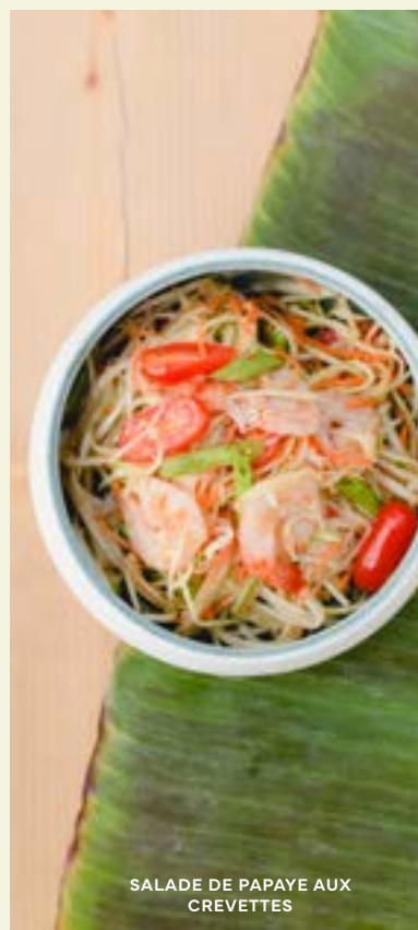
SALADE DE PAPAYE AUX CREVETTES