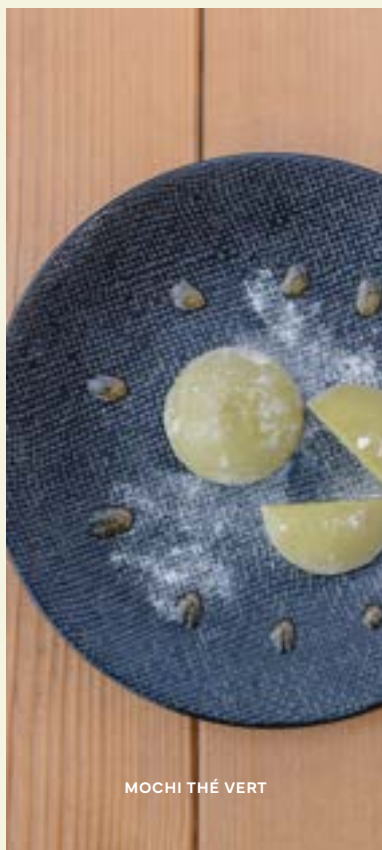
MOCHI THÉ VERT