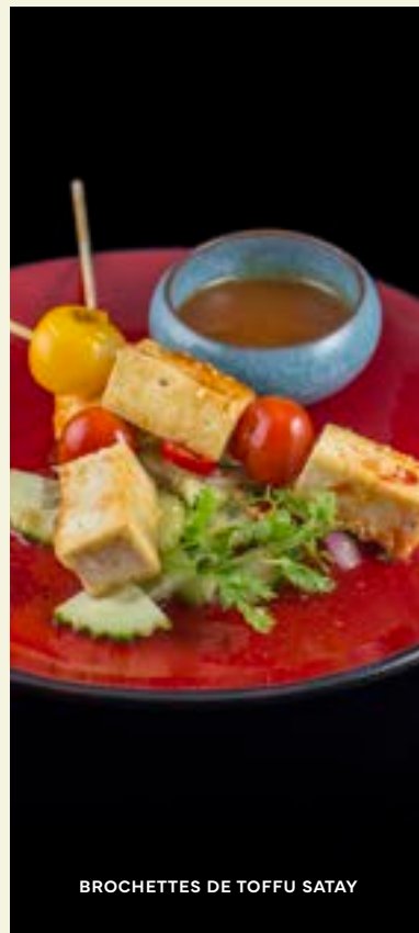
BROCHETTES DE TOFFU SATAY