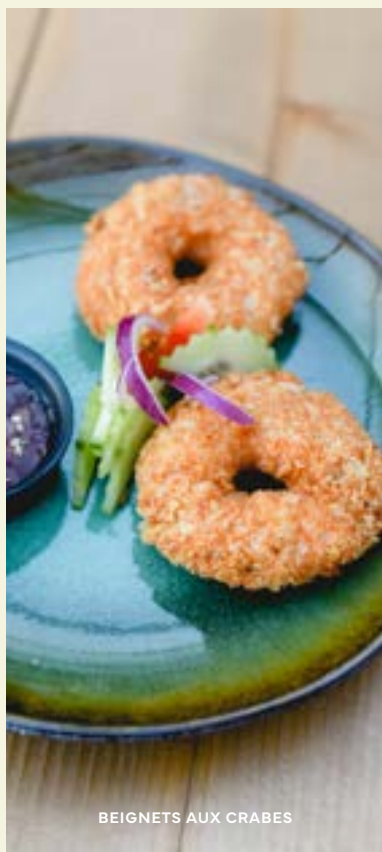
BEIGNETS AUX CRABES