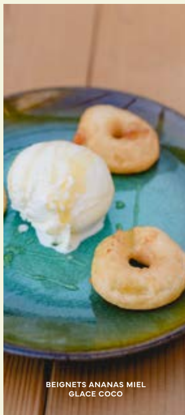
BEIGNETS ANANAS MIEL GLACE COCO